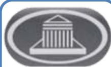
ЛГУ им. А.С.Пушкина